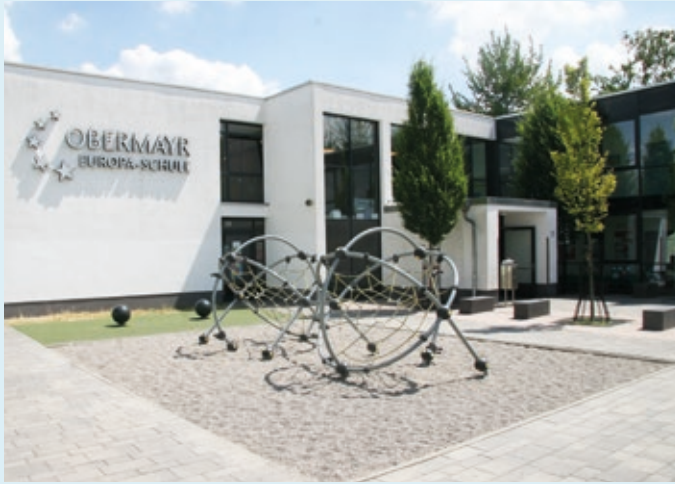
Gebäude Sekundarstufe I

IMPULSE für die ZUKUNFT ENTDECKEN BEGREIFEN LERNEN