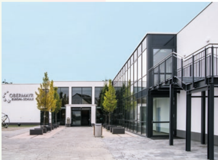
Gebäude Sekundarstufe I