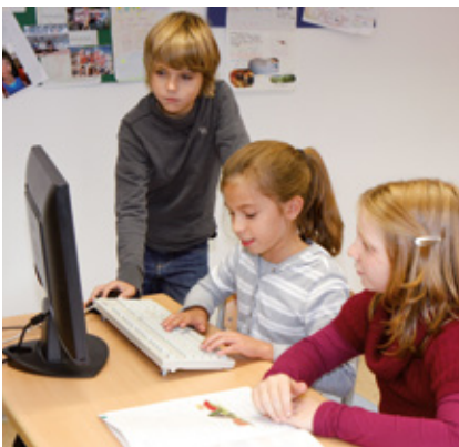
Informations- und kommunikationstechnische Bildung

Der bilinguale Unterricht vermittelt den Schülerinnen und Schülern in der Sekundarstufe I eine sprachliche Kompetenz, die über die Fremdsprachenkenntnisse eines normalen Englischunterrichts hinausgeht. Im Vordergrund steht die Sprachanwendung in kontextuellen Zusammenhängen. Die Schule wendet das sog. CLIL-Konzept an, in dem Fremdsprache und Inhaltsvermittlung miteinander verbunden werden.